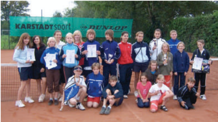
Unsere Juniorinnen und Junioren bei den Vereinsmeisterschaften im September

Für die Erwachsenen hatte die Sparte am 04. Oktober zum gemeinsamen Abspielen der Freiluftsaison eingeladen. Nach den letzten Ballwechsellern unter herbstlichen Sonnenstrahlen wurde der letzte „Freilufttennistag 2008“ mit einem gemütlichen Zusammensein beendet. Diese vom Festausschuss hervorragend organisierte Veranstaltung wird allen Teilnehmern noch lange in Erinnerung bleiben.