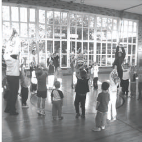
Zum Aufwärmen für den Kinderturntest wurde zum Lied „Theo, Theo ist fit“ getanzt

Zwischendurch konnten sich die Kinder und fleißigen Helfer am gesunden Buffet mit Milch, Obst, Gemüse und leckeren Krapfen stärken. Zum Ende des Tages wurden alte ausrangierte Turngeräte versteigert. Eine stolze Summe von 256 € kam zusammen. Davon werden jetzt neue Turnmatten für die Turnhalle angeschafft.