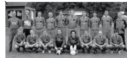
Aktuelles Foto der erfolgreichen Herrenmannschaft

Verfügung, ebenso wie Nuri Gündüz. Der neue Trikot-Sponsor Uwe „DRS“ unterstützt die Herren bei allen Heim- und Auswärts-spielen. Zur Stärkung des Teamgeistes und Steigerung des Spaßfaktors machte die 1. Herren einen Ausflug in den Snowdome nach Bisingen. Die Weihnachtsfeier ist gemeinsam mit den Spielerfrauen im Sporthaus geplant. Anfang nächsten Jahres beginnt das Trainingsjahr mit einem sportlichen Aufbauprogramm im Sporthotel Fuchsbachtal in Barsinghausen. Sonntag, den 01.02.2009, wird dort um 13:00 Uhr erstmalig der Fünftligist SV Ramlingen-Ehlershausen zu einem Testspiel empfangen.